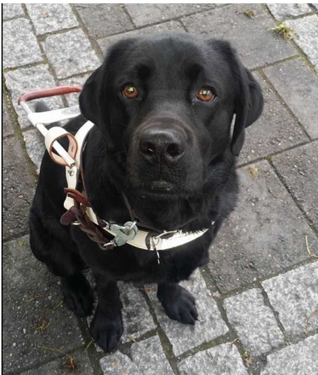
Nico på jobb