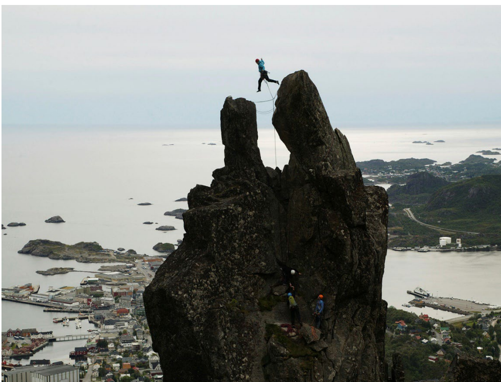
Men ikke alt skal være universelt utformet