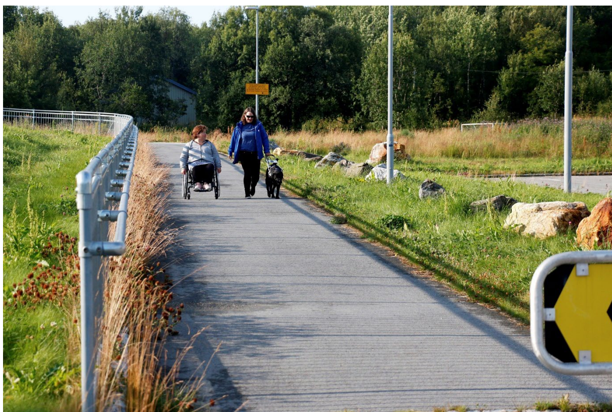
Utenfor Mørkved stasjon.

Rådet for personer med funksjonsnedsettelse arbeider etter den politiske målsetningen om full deltakelse og likestilling for funksjonshemmede i samfunnet. CRPD er et sentralt redskap i dette arbeidet. Dette gjelder hovedsaklig arbeid for å fremme likestilling og motvirke diskriminering av personer med funksjonsnedsettelse.