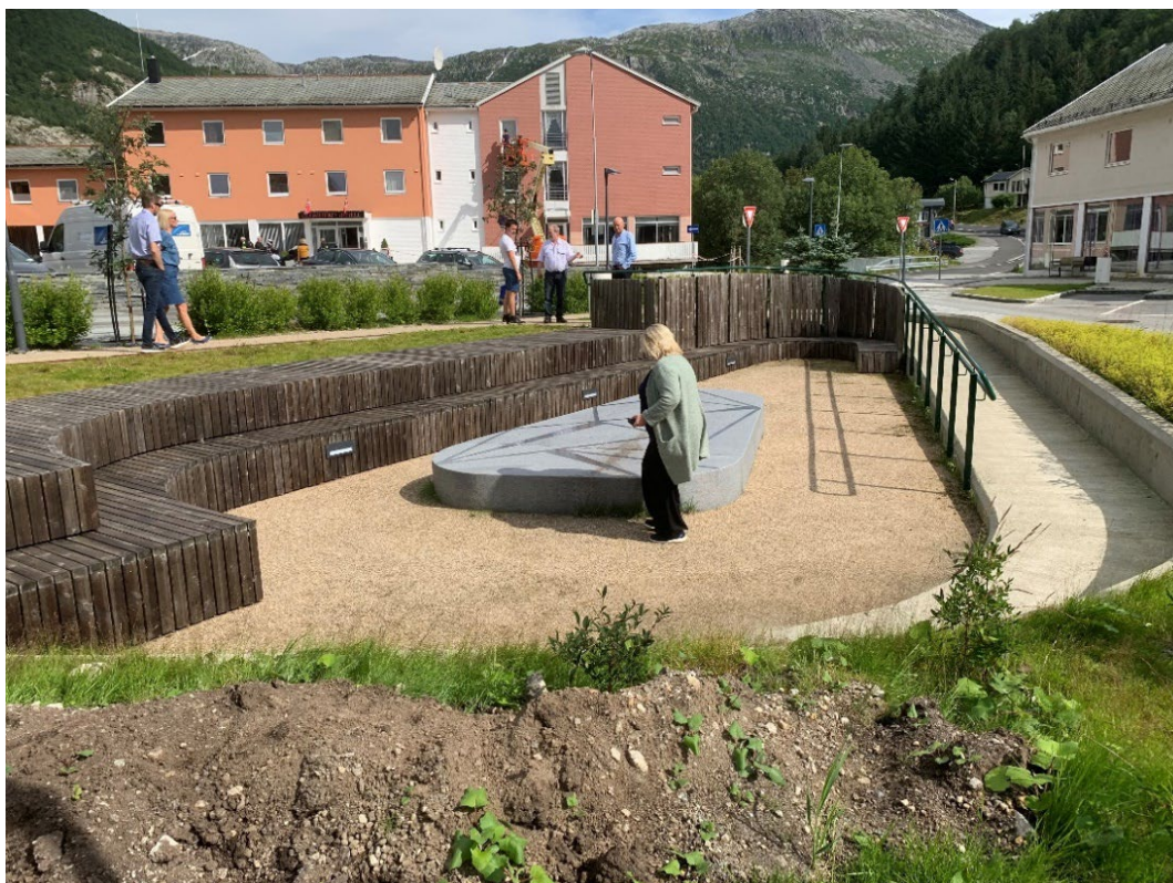
Universelt utformet Glomfjord torg