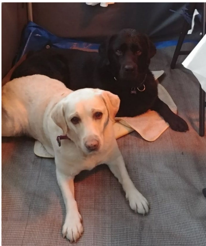
Nico og en eldre kollega