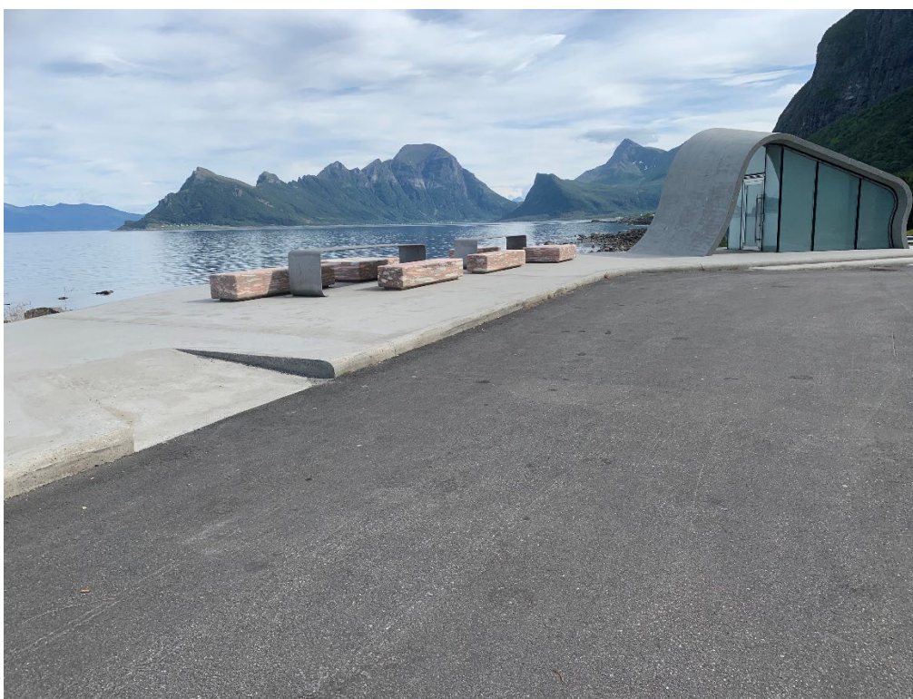
Universelt utformet rasteplass – Ureddplassen

Reglement for rådet for personer med funksjonsnedsettelse i Nordland finnes her på internett.