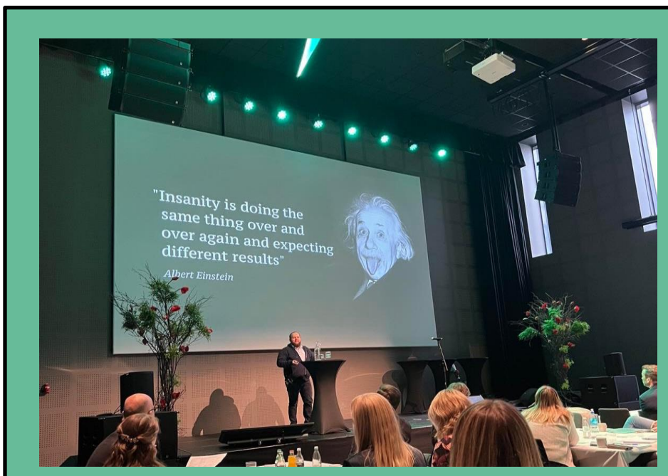
Kompetanseforum Nordlands årskonferanse FRAMDRIFT, Scandic Havet Bodø 21. sept. 2022