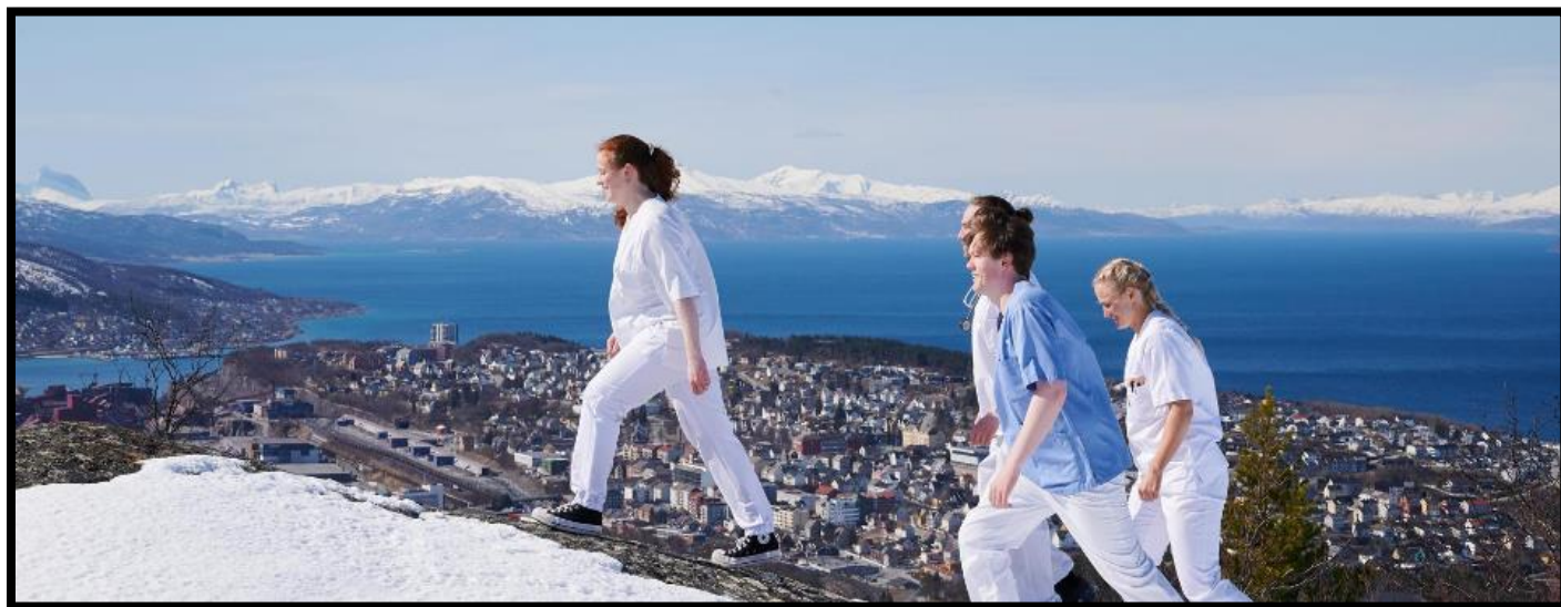
Fagarbeiderløftet Ofoten.

For spørsmål knyttet til Utdanningsløftet, ta kontakt med prosjekt- og utviklingsrådgiver Ragnhild Gundersen, e-post raggun@nfk.no