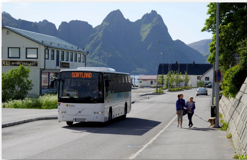
Myre, Øksnes kommune