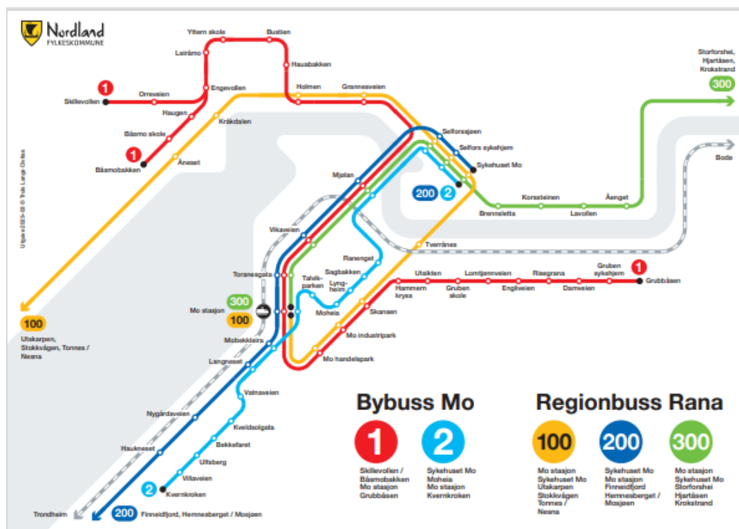
Figur 3: Oversikt over bybuss Mo og regionbuss Rana

Mo i Rana har et busstilbud med bybusser som har et tilbud med halvtimes ruter i rusket på morgnen og ettermiddagen, og timesfrekvens resten av dagen (linje 1). Linje 2 til sykehuset har halvtimes frekvens frem til 17 og timesfrekvens frem til 20 på hverdager. Lørdager er det timesfrekvens (Nordland fylkeskommune, 2024). Det er også regionbusser fra Mo i Rana til Nesna, Mo i Rana til Mosjøen og fra Mo i Rana til Krokstrand.