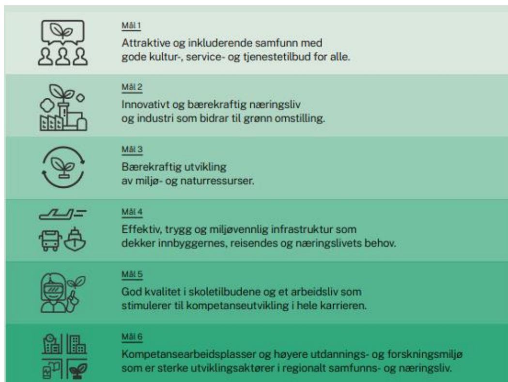
Figur 1: Langsiktige utviklingsmål, Planstrategi for samarbeid og grønn omstilling 2021–2024, Nordland fylkeskommune

I gjeldende regionale planstrategi er det vedtatt seks langsiktige utviklingsmål for Nordland, som er vist nedenfor. For hvert mål er det identifisert hvilke regionale planer som trengs for å oppnå dem. I tillegg er konkrete satsinger for valgperioden koblet til hvert utviklingsmål.