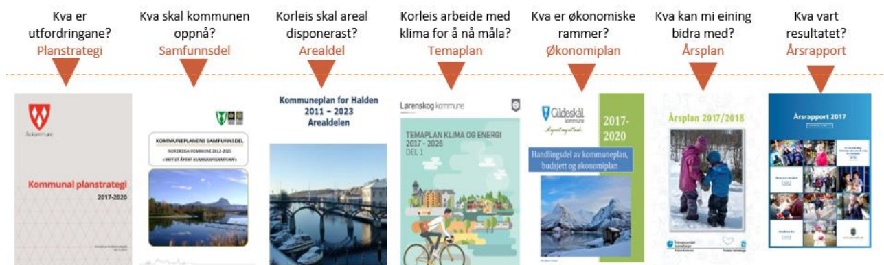
Figur 3: Samanhangen i det kommunale plansystemet – eit døme (bileta er illustrasjon, ikkje frå ein og same kommunen)

Kjennskap til plansystem i kommunane, er ein svært viktig føresetnad for å kunne bruke kunnskap om helsefremjande nærmiljø som grunnlag for planar og avgjerder. I figur 3, som følgjer, er det gjort eit forsøk på å vise samanhangen mellom planstrategi og ulike kommunale planar. Vi trur at fleire av dei som er involverte i dei lokale delprosjekta må bli endå meir bevisste på korleis det kommunale plansystemet fungerer, og tenke gjennom korleis planleggingsprosessar kan brukast for å styrke folkehelsearbeidet i kommunen. Ikkje minst er det grunn til å nemne at planarbeid kan vere ein føremålstenleg arena for tverrfagleg, tverrsektoriell og politisk forankring. Kunnskap om politikk og politiske prosessar er også ein fordel når det gjeld å forankre arbeidet med helsefremjande nærmiljø i ein kommune.