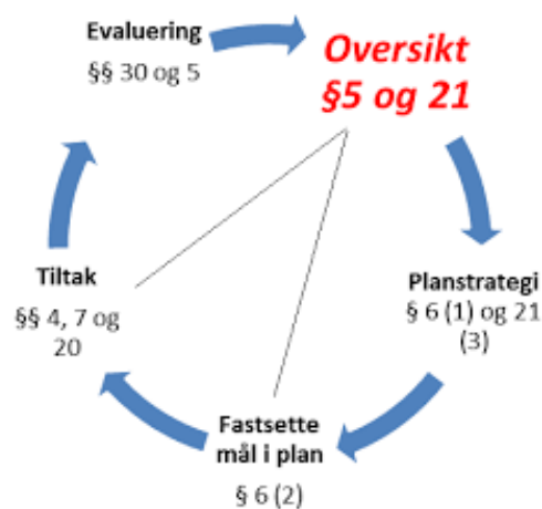
Figur 2. Det systematiske folkehelsearbeidet

Kommunal folkehelseoversikt er sentral i det systematiske folkehelsearbeidet, og skal vere eit viktig utgangspunkt for planarbeid og tiltak i kommunane. For at oversikta på best mogleg måte skal fange opp både utfordringar og faktorar som folk opplever som helsefremmande, må oversikta vere basert på opplysningar og data som er samla både gjennom kvantitative og kvalitative metodar. Elementa og logikken i det systematiske folkehelsearbeidet er skissert i figuren som følgjer.