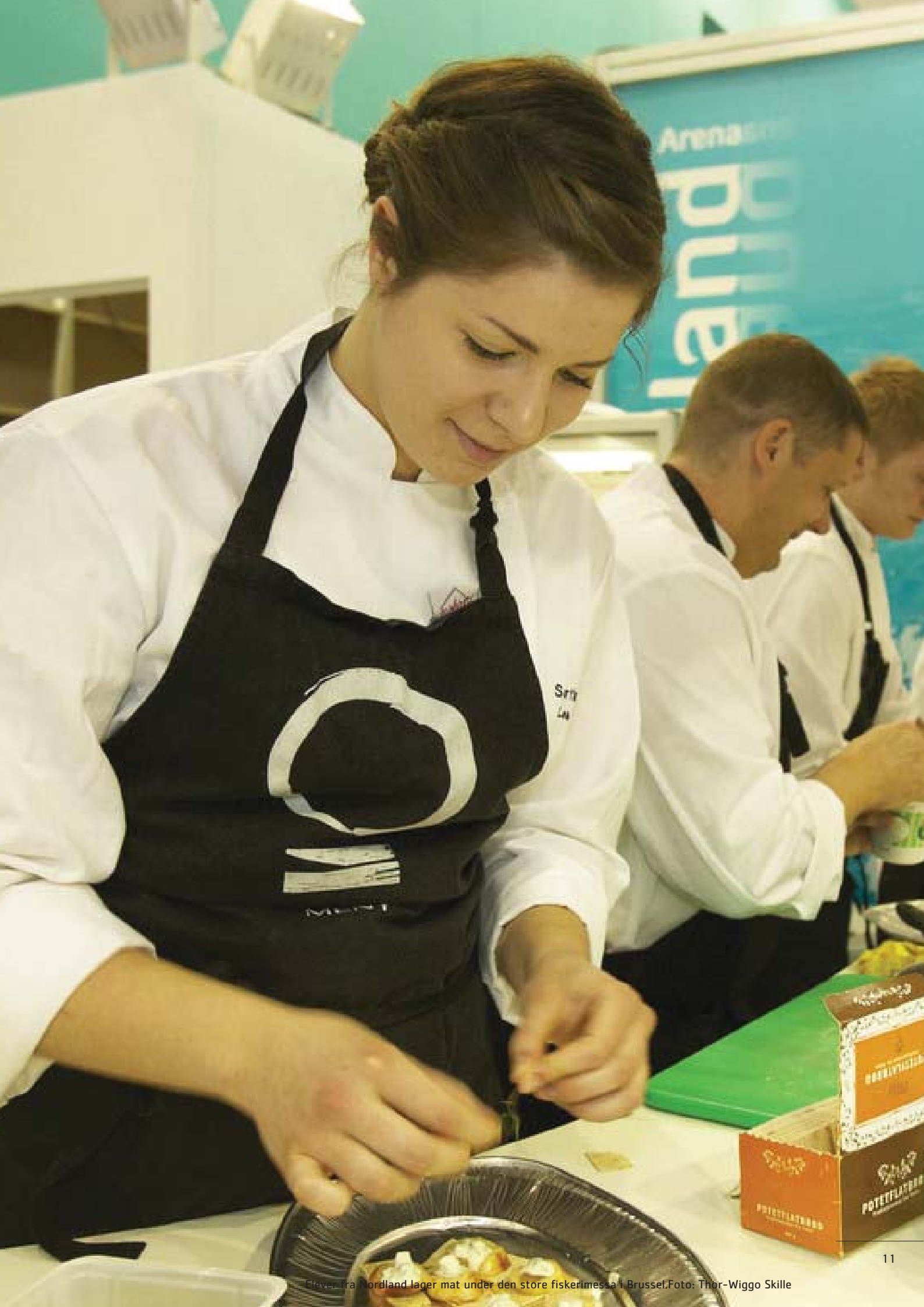
Chefer fra Nordland lager mat under den store fiskerimessa i Brussel.