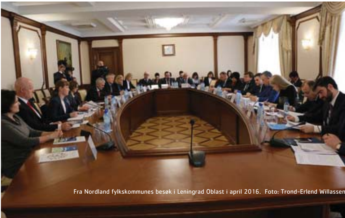
Fra Nordland fylkskommunes besøk i Leningrad Oblast i april 2016.

Bl.a. gjennom EØS-avtalen er Norge tett knyttet til EU. Kunnskap om EUs politikk på områder som regional utvikling, forskning og utvikling, statsstøtteregler, utdanning, energi og miljø, er viktig for å kunne bistå bedrifter og befolkning i Nordland på en hensiktsmessig måte.