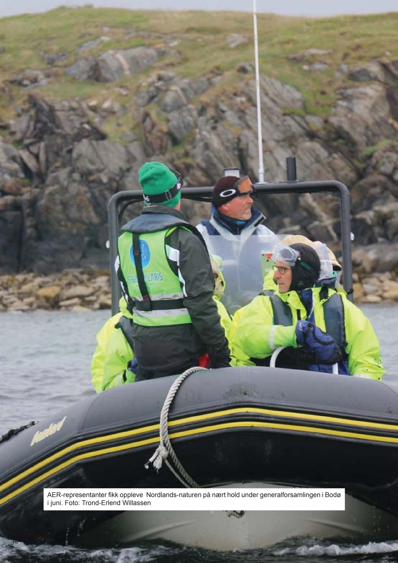
AER-representanter fikk oppleve Nordlands-naturen på nært hold under generalforsamlingen i Bodø i juni.