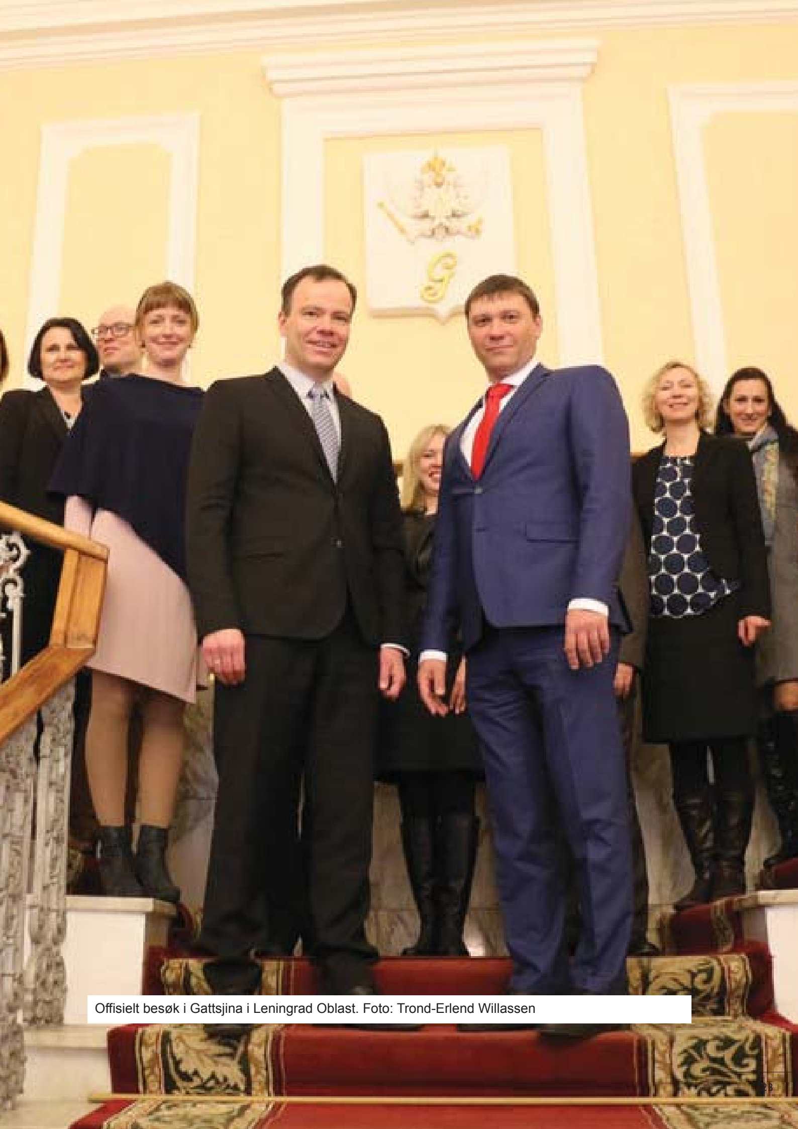
Offisielt besøk i Gattsjina i Leningrad Oblast.